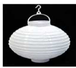
한지 등(燈) 만들기